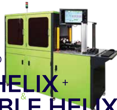
HELIX + & DOUBLE HELIX