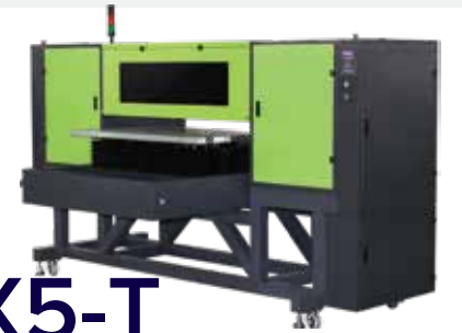
X5 & X5-T