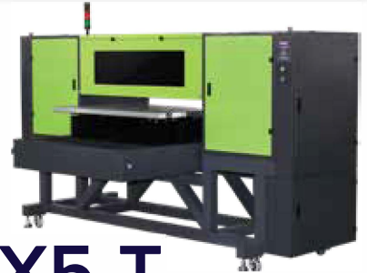
X5 & X5-T